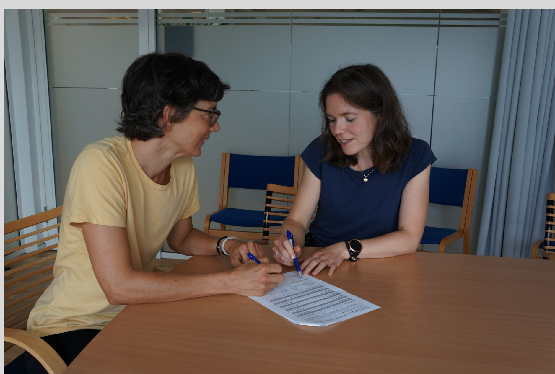
Der er fokus på Trin 4 i "Raketten", så uddannelseslægen bliver klar til endnu en tur i "Raketten".